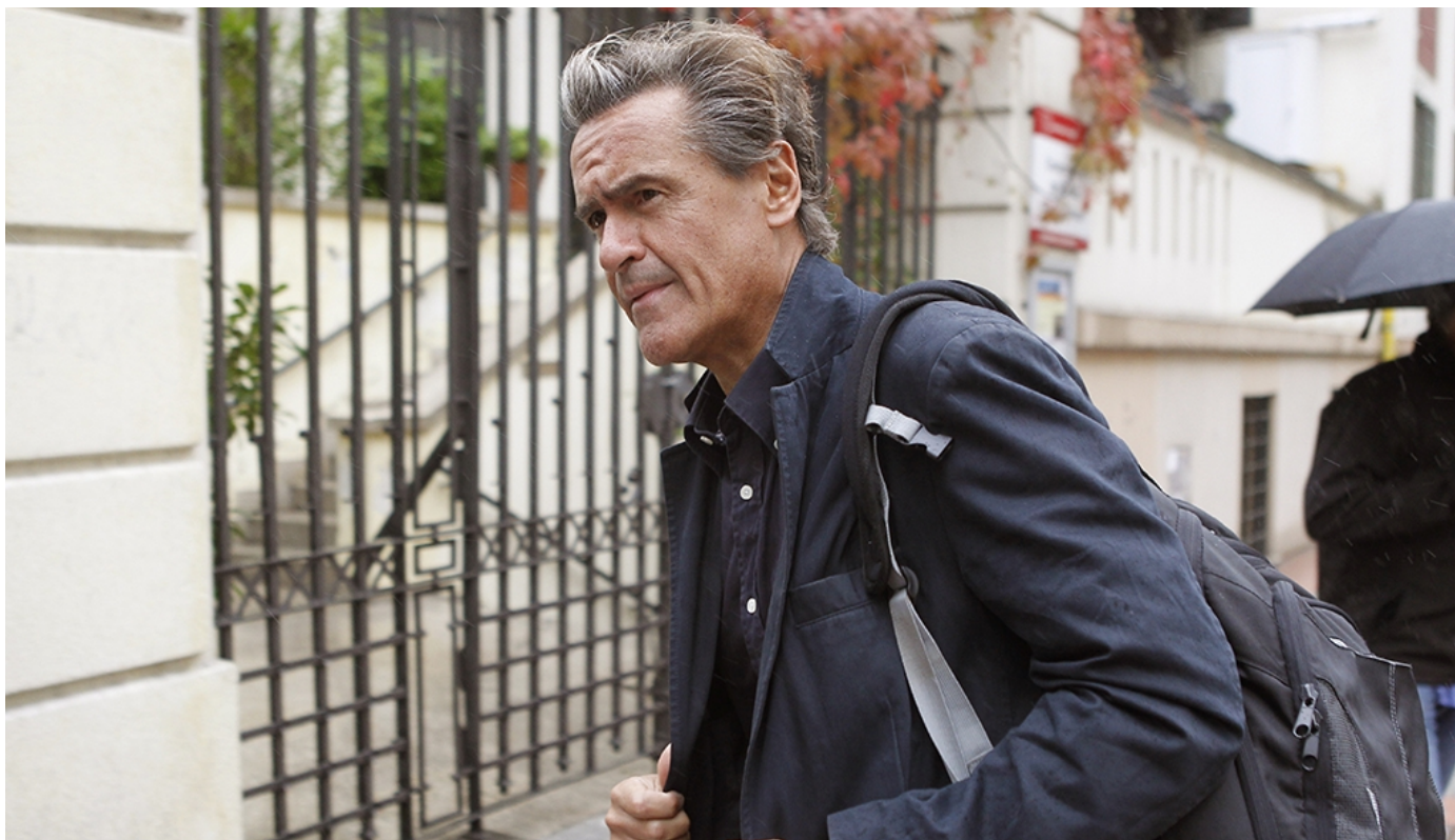
El eurodiputado socialista y miembro de la comisión de Libertades, Justicia e Interior de la Eurocámara, Juan Fernando López Aguilar

BRUSELAS / Tras la aprobación en Hungría de la nueva ley sobre instituciones de educación superior extranjeras y que supondría el cierre de la Universidad Centroeuropa (CEU), el eurodiputado socialista y miembro de la comisión de Libertades, Justicia e Interior de la Eurocámara, Juan Fernando López Aguilar, ha levantado la voz contra una iniciativa que "pretende regular al profesorado y alumnado, limitar el acceso de extranjeros a la educación, menoscabar la libertad de enseñanza y el principio de no discriminación".