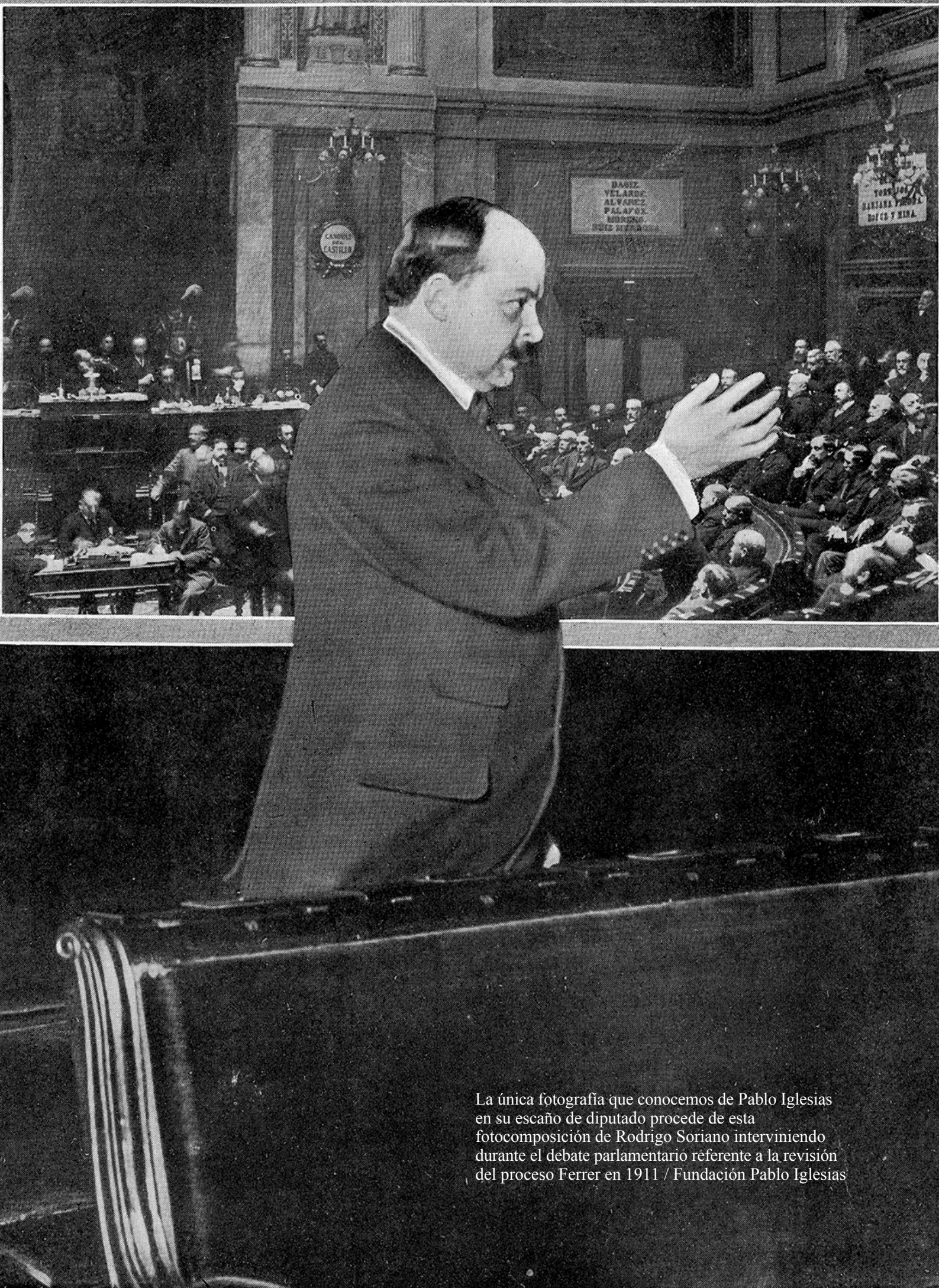
La única fotografía que conocemos de Pablo Iglesias en su escaño de diputado procede de esta fotocomposición de Rodrigo Soriano interviniendo durante el debate parlamentario referente a la revisión del proceso Ferrer en 1911