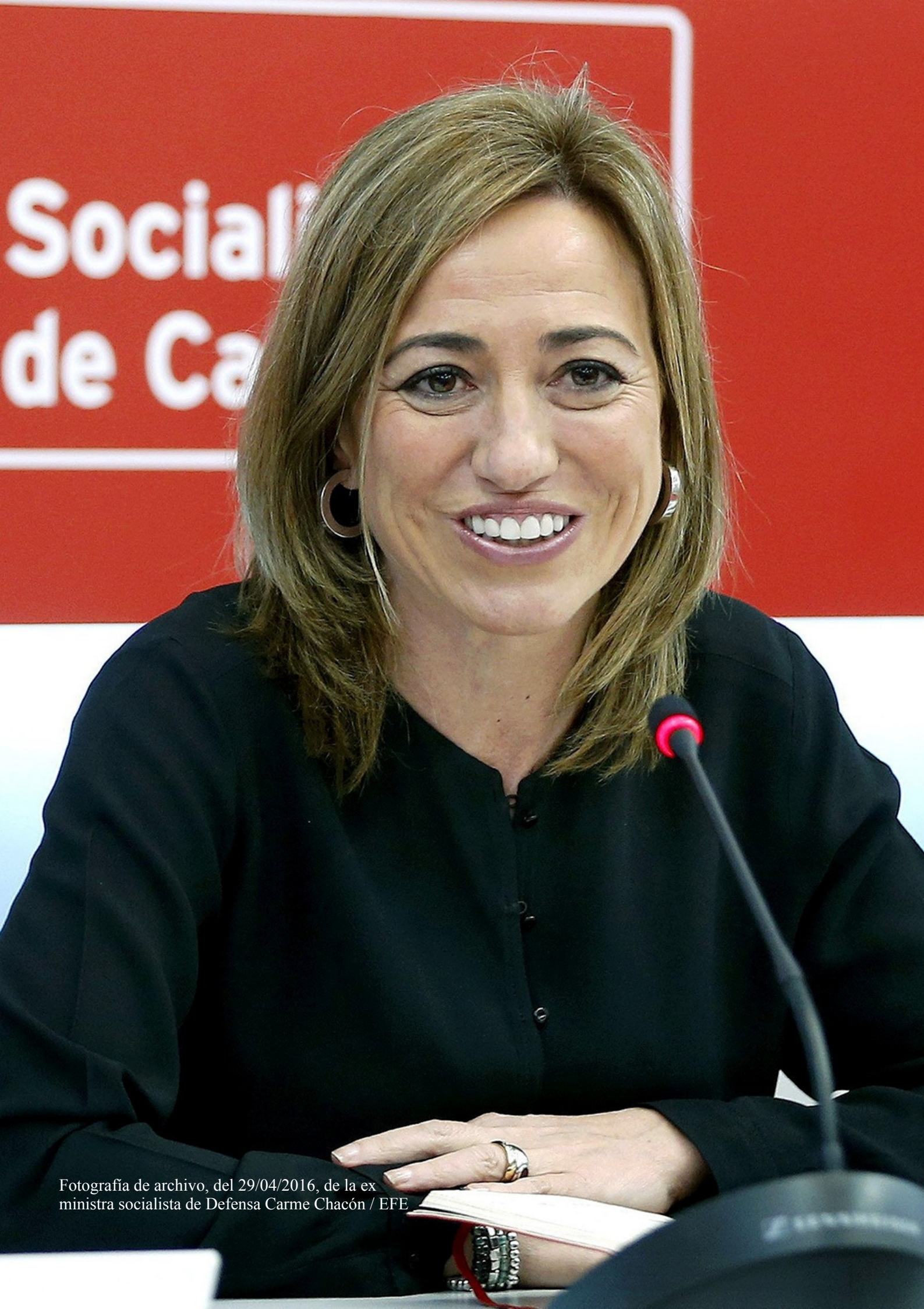
Fotografía de archivo, del 29/04/2016, de la ex ministra socialista de Defensa Carme Chacón