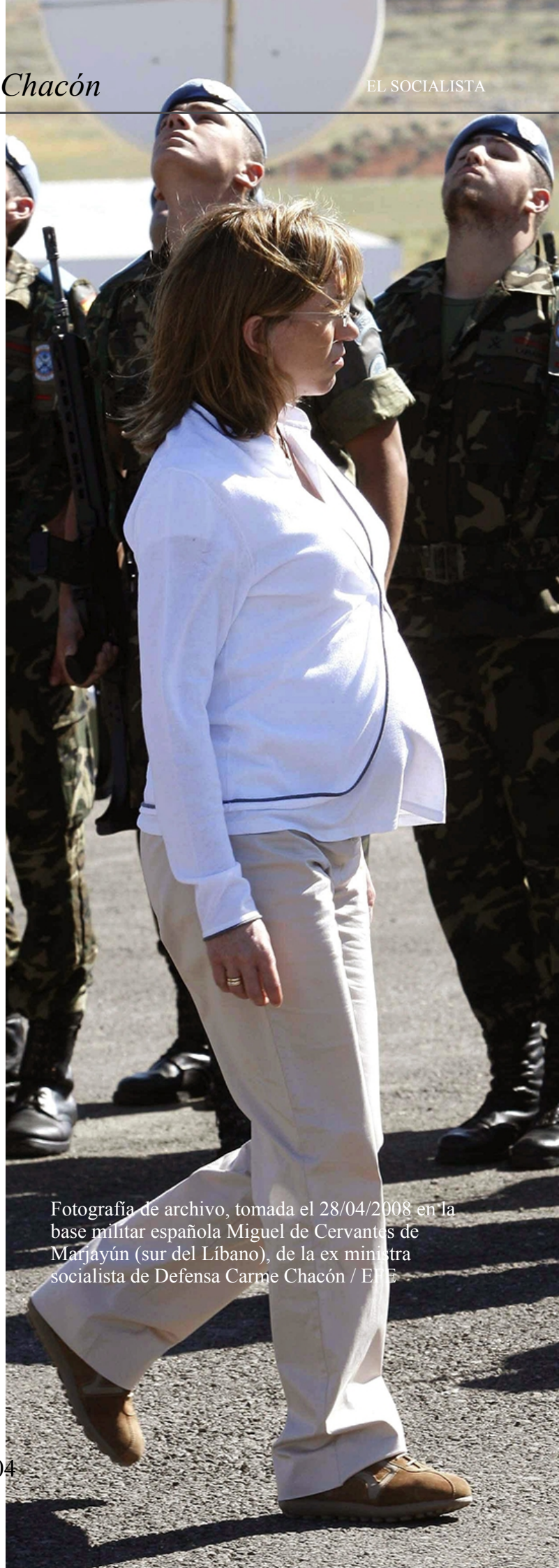
Fotografía de archivo, tomada el 28/04/2008 en la base militar española Miguel de Cervantes de Marjayún (sur del Líbano), de la ex ministra socialista de Defensa Carme Chacón