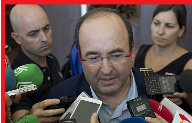
El primer secretario del PSC, Miquel Iceta

El líder del PSC, Miquel Iceta, ha instado al Govern a "tomar la palabra" y a exigir al Ejecutivo que sea la Generalitat quien se haga cargo de ejecutar las inversiones en las infraestructuras catalanas, tras constatar que las "promesas" del Gobierno "no constan" en las cuentas para 2017. Iceta ha encabezado una representación de diputados del PSC del Parlament y del Congreso que han mantenido una reunión de trabajo en Manresa, en la